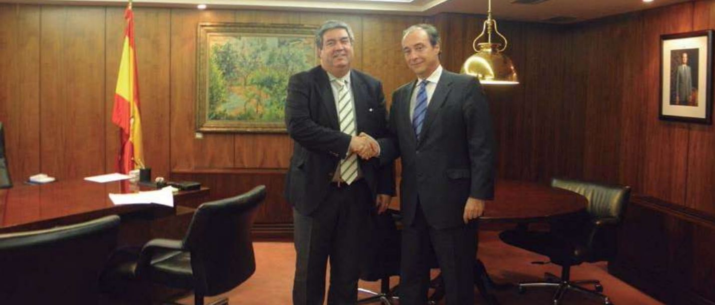
▲ Firma del acuerdo con Intrum Justitia.

En febrero CEPYME firmó un acuerdo con la Compañía Española de Financiación del Desarrollo (COFIDES) para impulsar la internacionalización de las pymes. Gracias a este acuerdo, ambas entidades cooperarán para prestar un apoyo conjunto que potencie las posibilidades de éxito de los proyectos de inversión en el exterior de las pymes españolas.