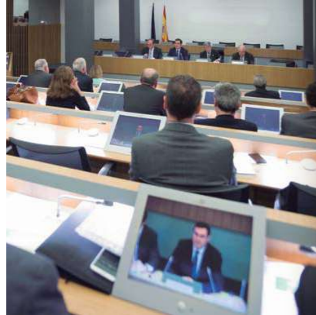
◀ Junta Directiva de la Confederación, celebrada el 17 de noviembre

Se inició entonces un nuevo proceso en la Confederación, en el que el entonces vicepresidente primero, Antonio Garamendi asumió la presidencia de la Confederación a propuesta de los vicepresidentes y la aprobación del Comité Ejecutivo. Este nombramiento fue ratificado el 17 de noviembre por la Junta Directiva de la Confederación y el 10 de diciembre por la Asamblea General con carácter extraordinario, convocada a tal efecto.