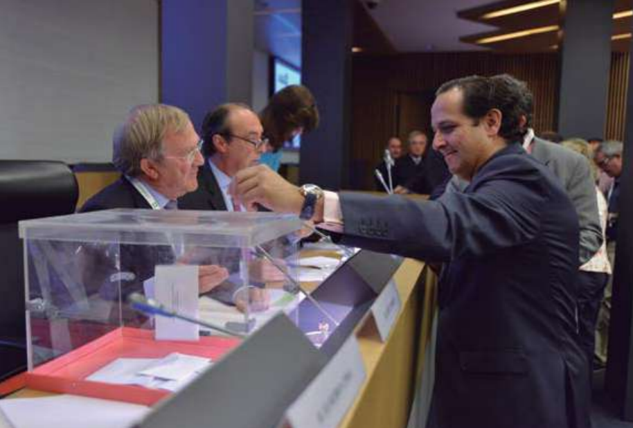
▲ Momento de las votaciones en la Asamblea General electoral celebrada en junio.