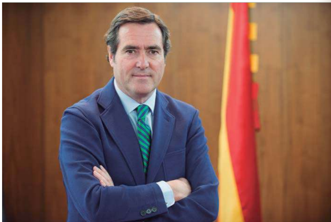
► Antonio Garamendi Presidente de CEPYME

dades de estas empresas, por lo que reclamamos una reducción en el entorno al entorno del 15-20%.