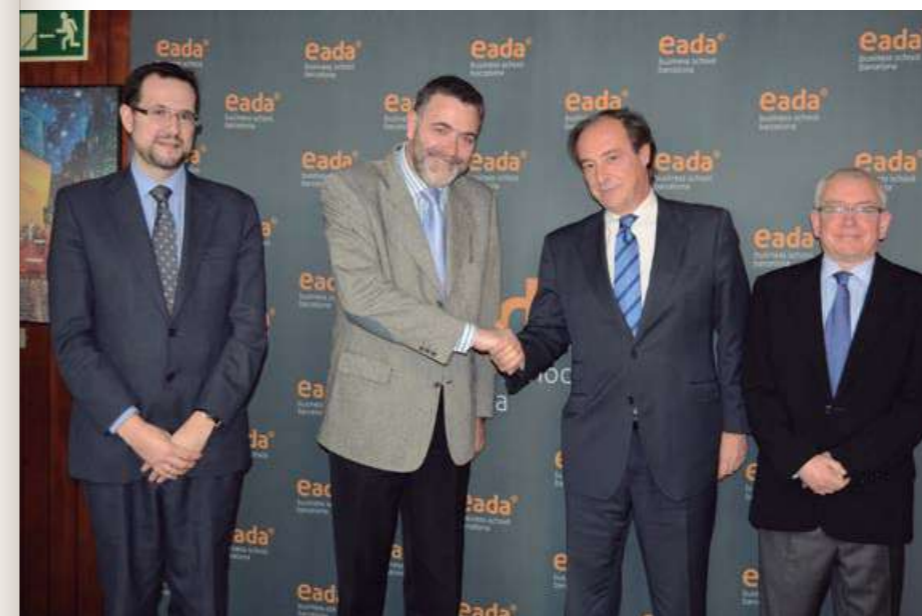
▼ Acuerdo con EADA

Igualmente, hay que reseñar la colaboración que CEPYME mantuvo con otras empresas e instituciones, en el marco de acuerdos de colaboración vigentes, como lo que CEPYME