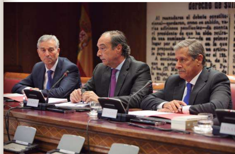
▲ El secretario general de CEPYME, durante su intervención en el Senado.

En opinión de CEPYME, la reforma representaba una oportunidad perdida para abordar una reforma fiscal en España adecuada a las necesidades de las pymes y para la mejora de la competitividad de las empresas. En concreto, CEPYME expresó su malestar en relación con el tipo nominal del 25% en el Impuesto de Sociedades, aplicable para todas las empresas, que la Confederación estimó excesivo y solicitó una reducción adicional para las pymes, en un intervalo comprendido entre el 15% y el 20%.