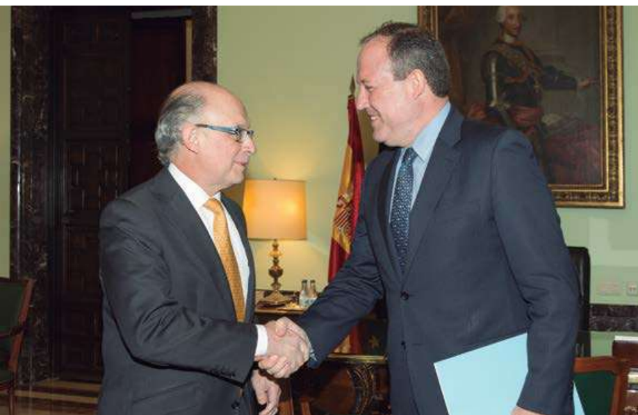
▲ El ministro de Hacienda durante su reunión con el presidente de CEPYME.

Otro ámbito de la actuación de CEPYME durante el año al que se refiere la presente Memoria fue la fiscalidad. En 2014 el Gobierno anunció una reforma fiscal, que finalmente fue aprobada en el mes de junio, con efectos a partir del 1 de enero de 2015, que contenía, entre otras medidas, una modificación del Impuesto sobre Sociedades. Antes de la aprobación de dicha reforma, CEPYME y CEOE trasladaron