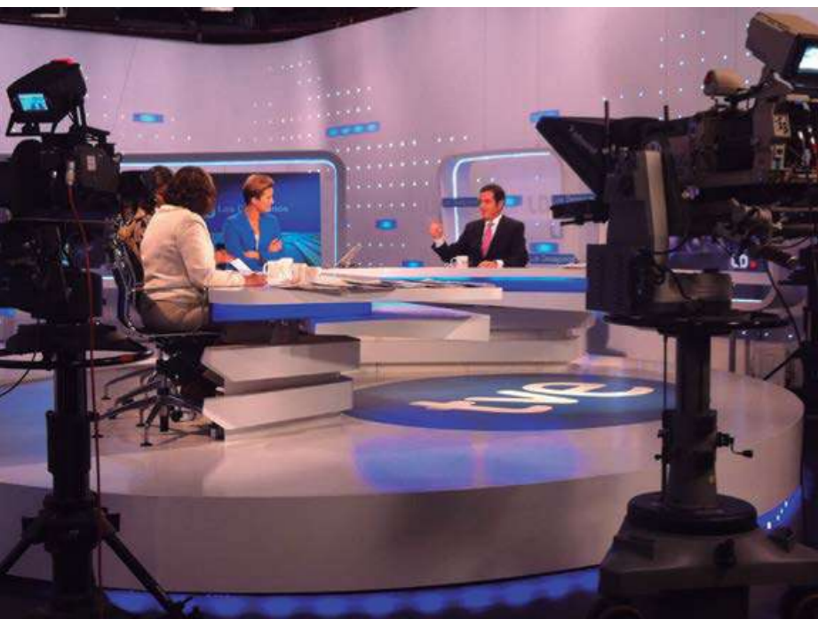
▲ El presidente de CEPYME durante su entrevista en Los Desayunos de TVE.

con distintas empresas e instituciones y sobre las actuaciones desarrolladas en el marco de los mismos, como la nueva convocatoria de Becas Santander-CRUE-CEPYME, y la jornada llevadas a cabo en colaboración con Sage sobre la Zona Única de Pagos en Euros (SEPA) y el IVA de caja.