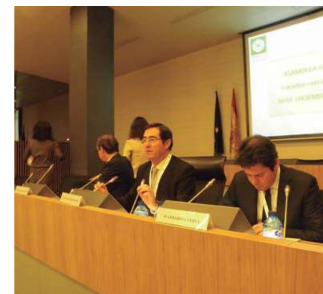
▼ Juan Rosell y Antonio Garamendi, tras la celebración de la Asamblea Electoral de CEOE.