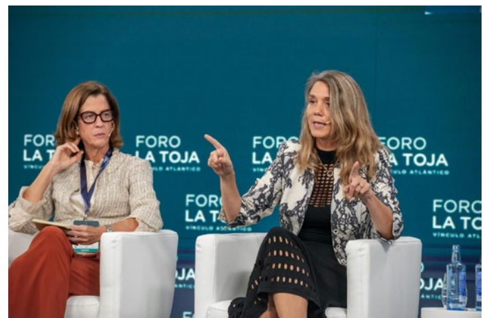
La presidenta de CEPYME, durante su intervención en el Foro La Toja.