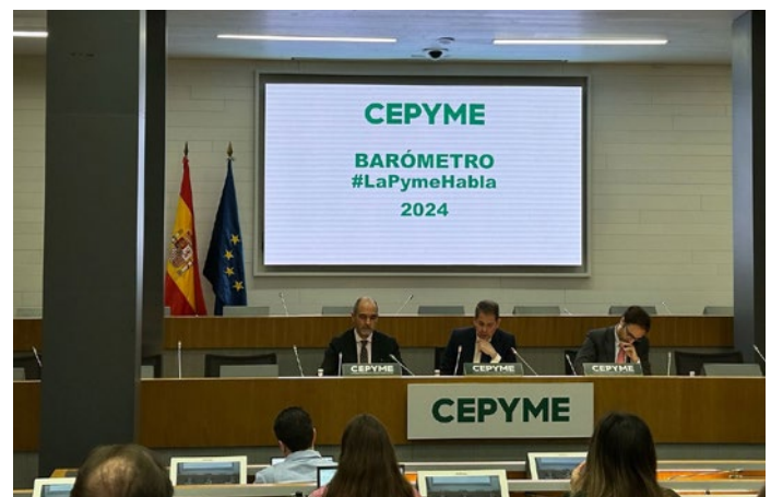
El entonces presidente de CEPYME presentó los resultados del Barómetro de la Pyme.