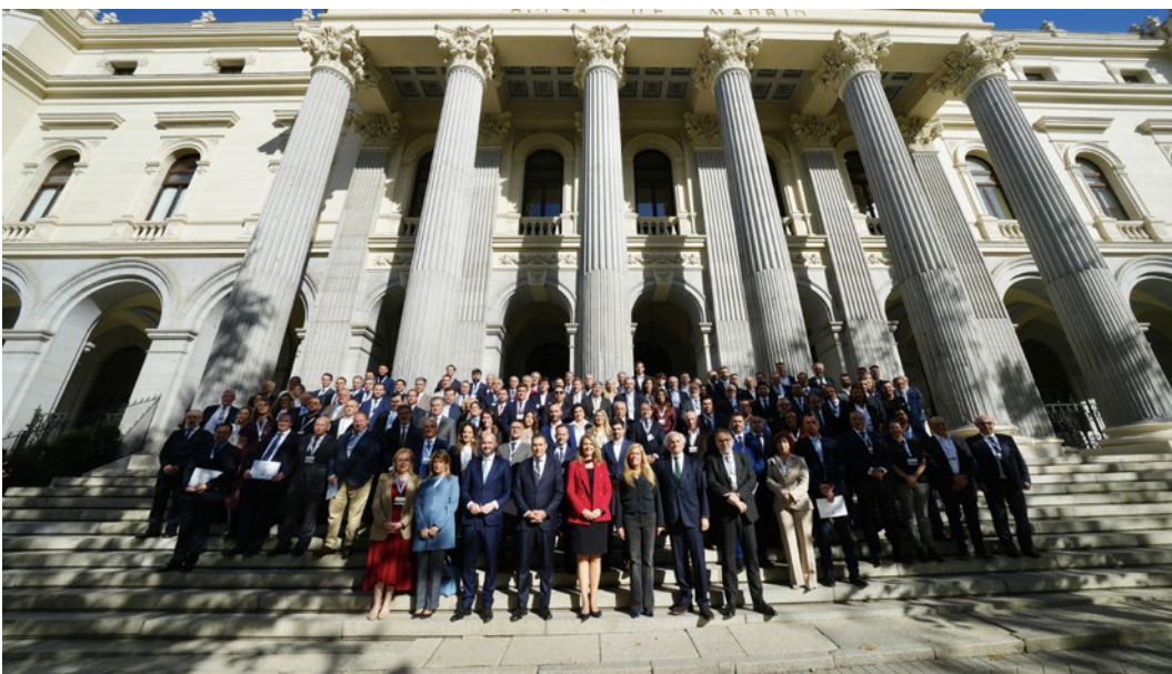
Foto de familia de las empresas CEPYME 500, patrocinadores del proyecto y representantes de CEPYME, ante la Bolsa de Madrid.

Como complemento del proyecto CEPYME500, y también con el objetivo de apoyar el crecimiento empresarial, en 2025 se mantuvo la iniciativa CreCepyme, que se centra en el acompañamiento y sensibilización por parte de grandes compañías a medianas empresas con un elevado potencial de crecimiento y que forman parte de CEPYME500, con el objetivo de mejorar su competitividad en las diferentes áreas que CEPYME ha identificado como barreras al crecimiento: la digitalización, el desarrollo social y la gestión del talento, entre otros. En 2025 cabe destacar las mentorizaciones de Ecoembes a la empresa Aceites de las Heras; de Mapfre a la empresa Mundopalet y de Orange a la empresa Panel Sandwich.