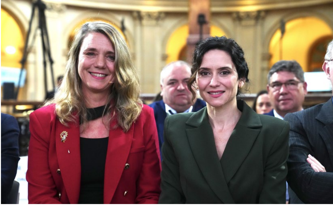
La presidenta de CEPYME y la presidenta de la Comunidad de Madrid.