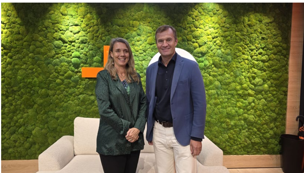
La presidenta de CEPYME y el CEO de MasOrange Meinrad Spenger, tras la renovación del acuerdo de colaboración entre ambas entidades.

El departamento se ocupa también de la planificación publicitaria de Cepymenews y de la revista El Empresario.