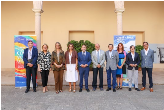
Foto de familia de los participantes en el curso de verano de la Universidad de Málaga, celebrado en Ronda.