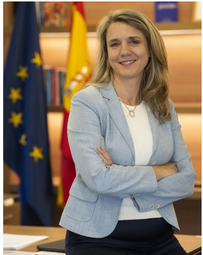
Ángela de Miguel Presidenta de CEPYME

A través de sus estudios e informes, como el Indicador CEPYME sobre la Situación de la Pyme , la Confederación continuó aportando una visión rigurosa sobre la evolución de la actividad empresarial, los costes, la financiación, la solvencia y la competitividad.