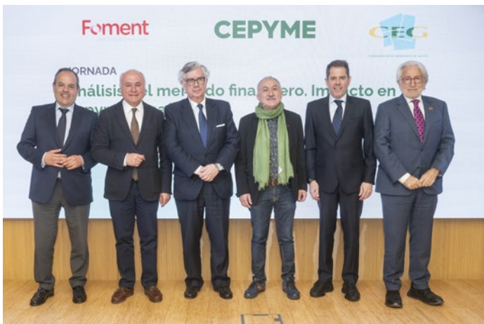
Foto de asistentes y participantes en la jornada sobre el mercado financiero y su impacto en la pyme.