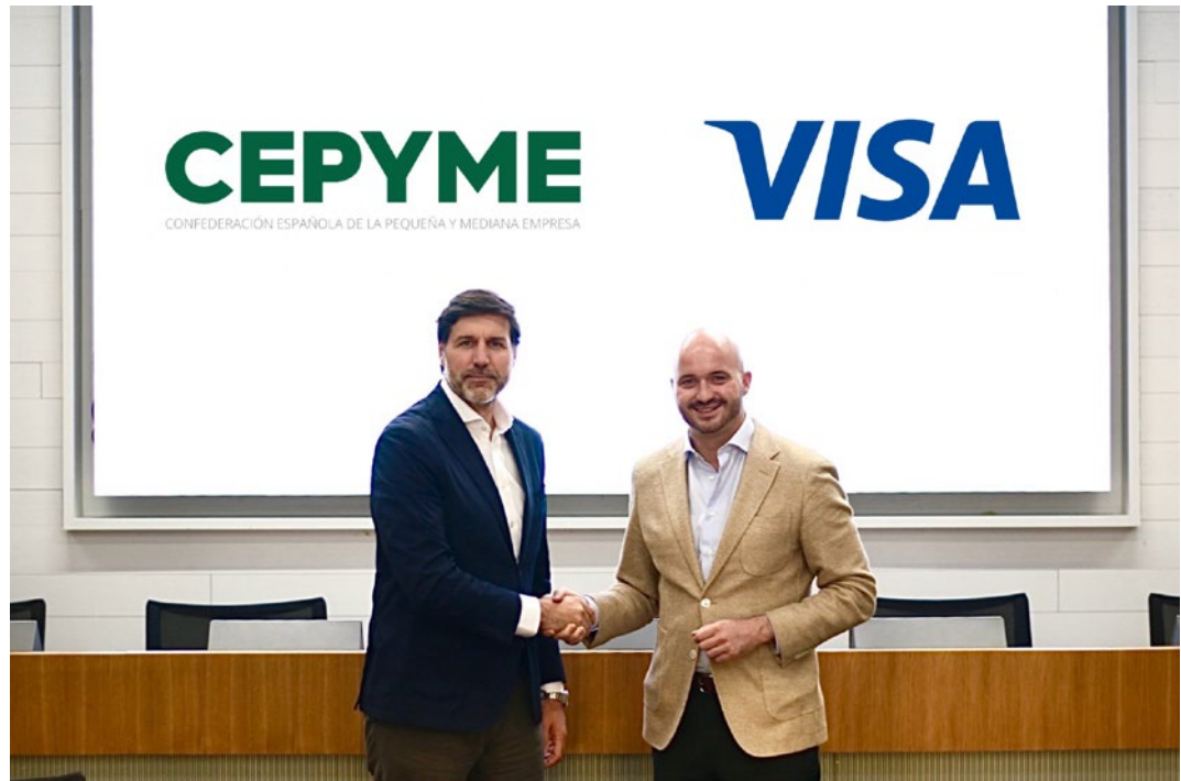
Firma de la renovación del acuerdo entre CEPYME y Visa.

te propuestas de valor dirigidas a instituciones, corporaciones e inversores.