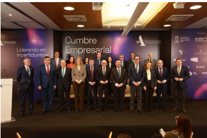
Foto de familia de los participantes en la Cumbre Empresarial de SEA Empresas Alavesas.

Los representantes de CEPYME participaron en los actos de entrega de premios de algunas organizaciones miembro, entre los que cabe destacar: