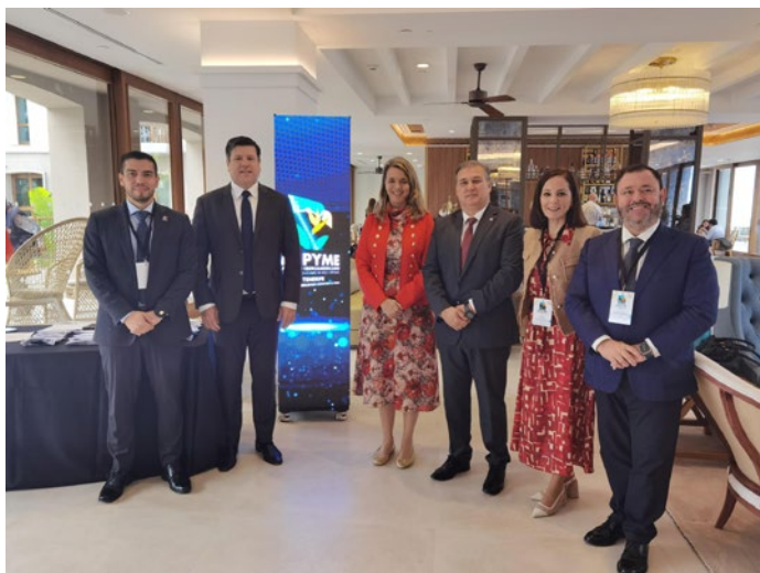
Reunión con el ministro de Industria de Paraguay y otros miembros del Gobierno de este país.

En el ámbito internacional, se mantuvieron encuentros con representantes de Gobiernos extranjeros y de otras instituciones, con el ministro de Industria y Comercio de Paraguay o la embajadora de Francia en España.