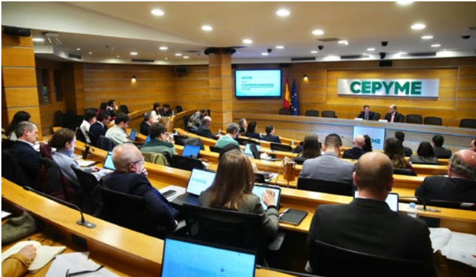
Un momento de la celebración de la jornada sobre Crecimiento Empresarial.