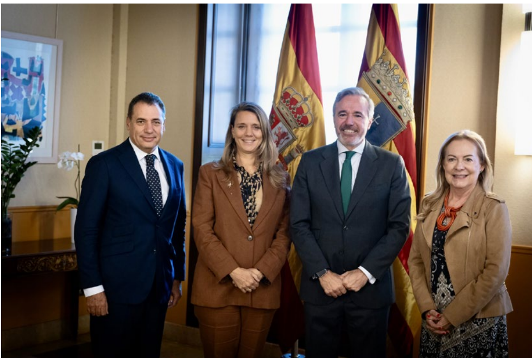
Reunión con el presidente del Gobierno de Aragón y los presidentes de CEOE Aragón y de CEPYME Aragón.

el presidente de la Región de Murcia, Fernando López Miras; el del Gobierno de Aragón, Jorge Azcón; la presidenta de la Comunidad de Madrid, Isabel Díaz Ayuso y con el alcalde de la capital, José Luis Martínez Almeida, entre otros.