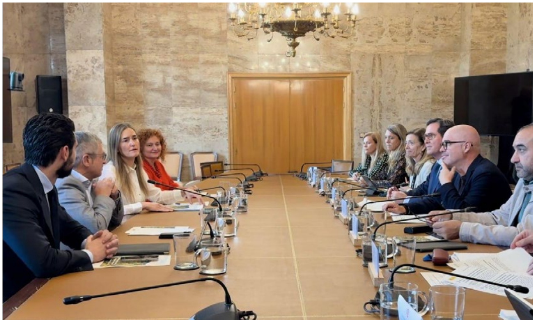
Reunión con la ministra para la Transición Ecológica y Reto Demográfico.

dente del Gobierno, Pedro Sánchez, y con miembros del Ejecutivo, entre ellos los titulares de Economía, Comercio y Empresa; Industria y Turismo; Trabajo y Economía Social; Transición Ecológica; Inclusión, Seguridad Social y Migraciones; Vivienda y Agenda Urbana y Transformación Digital y Función Pública.