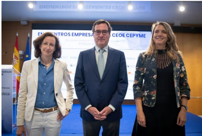
Encuentro Empresarial CEOE CEPYME protagonizado por Elodie Perthuisot, CEO de Carrefour España.