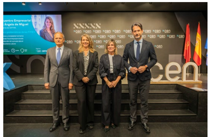
■ Encuentro Empresarial de CEN Empresa Navarra.