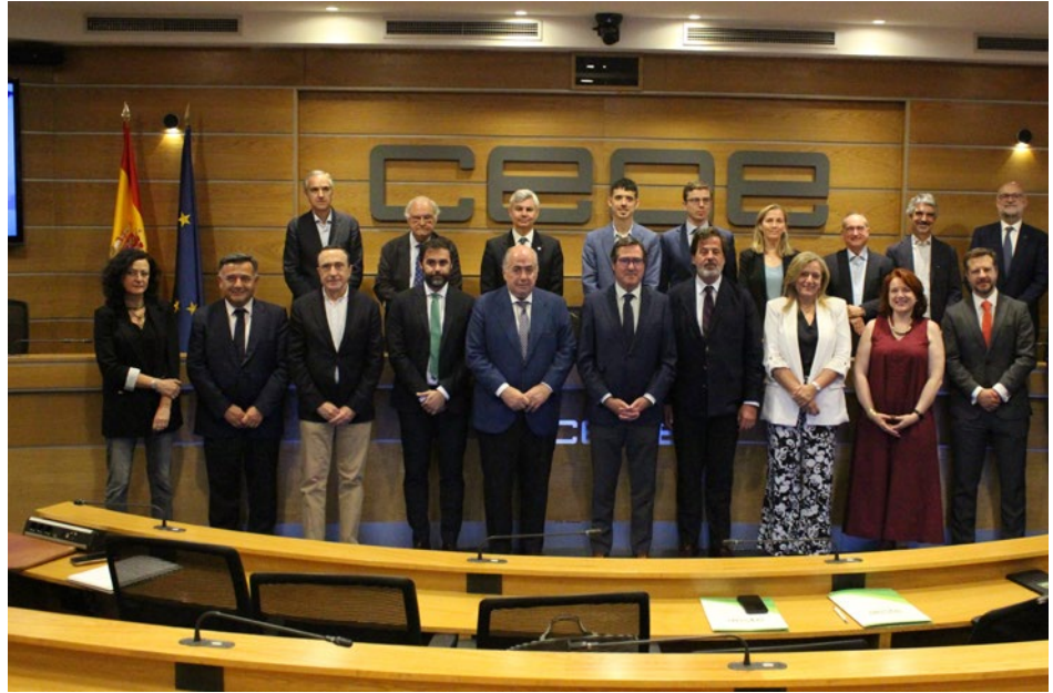
CEPYME participó en la firma de la Declaración de Principios de Sanidad, en el mes de junio.

Esta actividad se mantiene también en el ámbito del empleo, a través de las comisiones y consejos del Servicio Público de Empleo Estatal (SEPE), el seguimiento y evaluación del Sistema Nacional de Garantía Juvenil y el Centro Estatal de Orientación, emprendimiento, Acompañamiento e Innovación para el empleo (COE), entre otras.