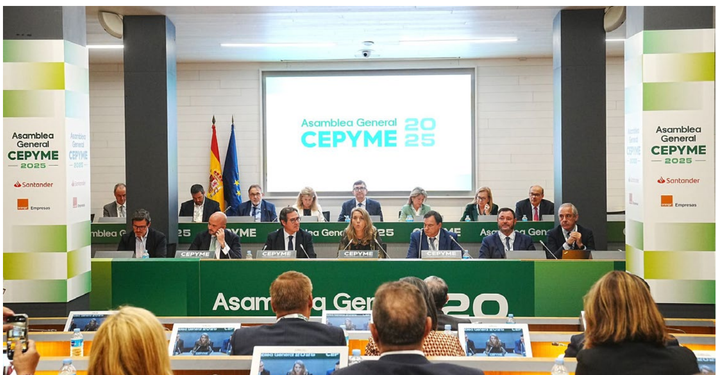
Asamblea General de CEPYME, celebrada en octubre.