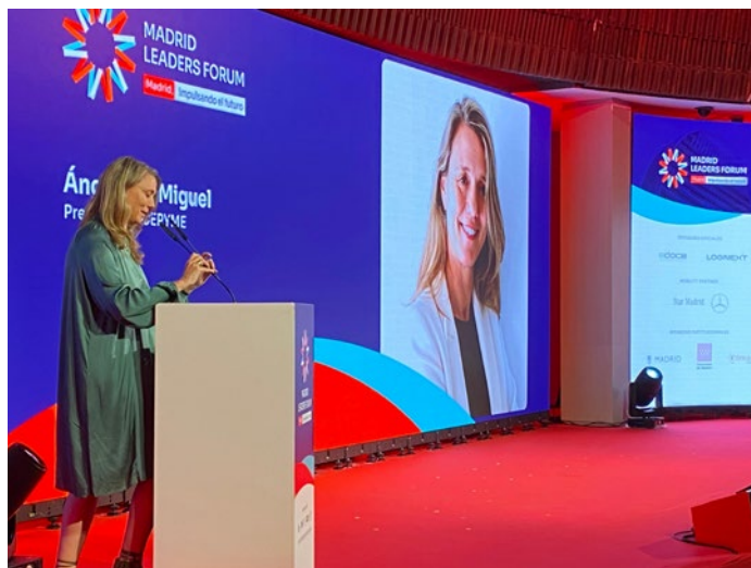
■ Clausura de Madrid Leaders Forum.