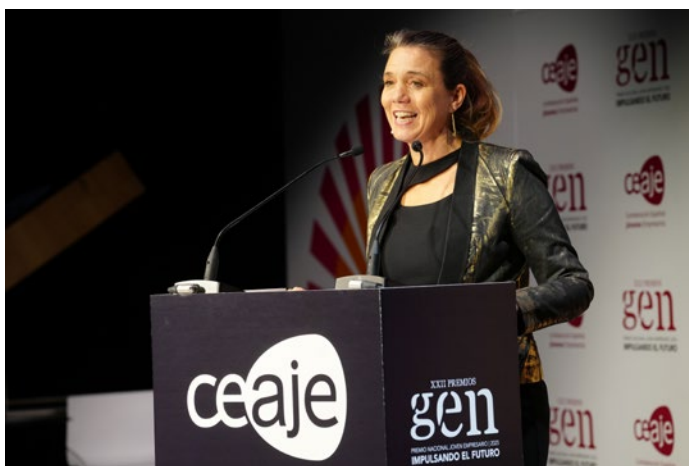
La presidenta de CEPYME, durante su intervención en la gala del Premio CAJE.