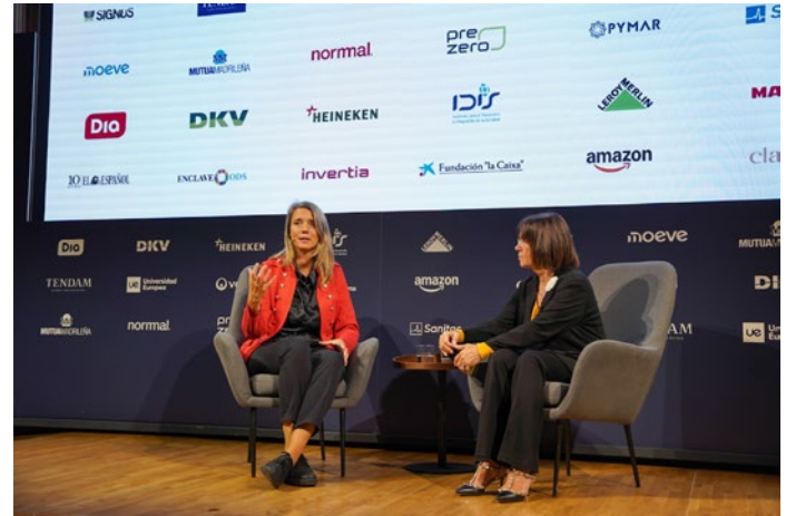
Participación en el IV Observatorio ODS 2030, organizado por El Español.