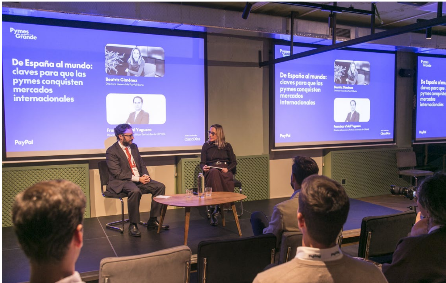
Participación en una jornada sobre las claves de la internacionalización de las pymes, organizada por Cinco Días.

de las finanzas en España, ha supuesto la inversión de importantes recursos con el fin de que la sostenibilidad sea una palanca que facilite la financiación y el desarrollo de la pyme y no una fuente de nuevos obstáculos en su día a día. En este sentido, dentro de los grupos de trabajo del Consejo, se ha hecho un especial esfuerzo para simplificar la información en materia de sostenibilidad que necesitan las entidades financieras de las pymes, pero también para que se aborde la educación financiera vinculada con la sostenibilidad bajo un enfoque dirigido a la pequeña y mediana empresa.