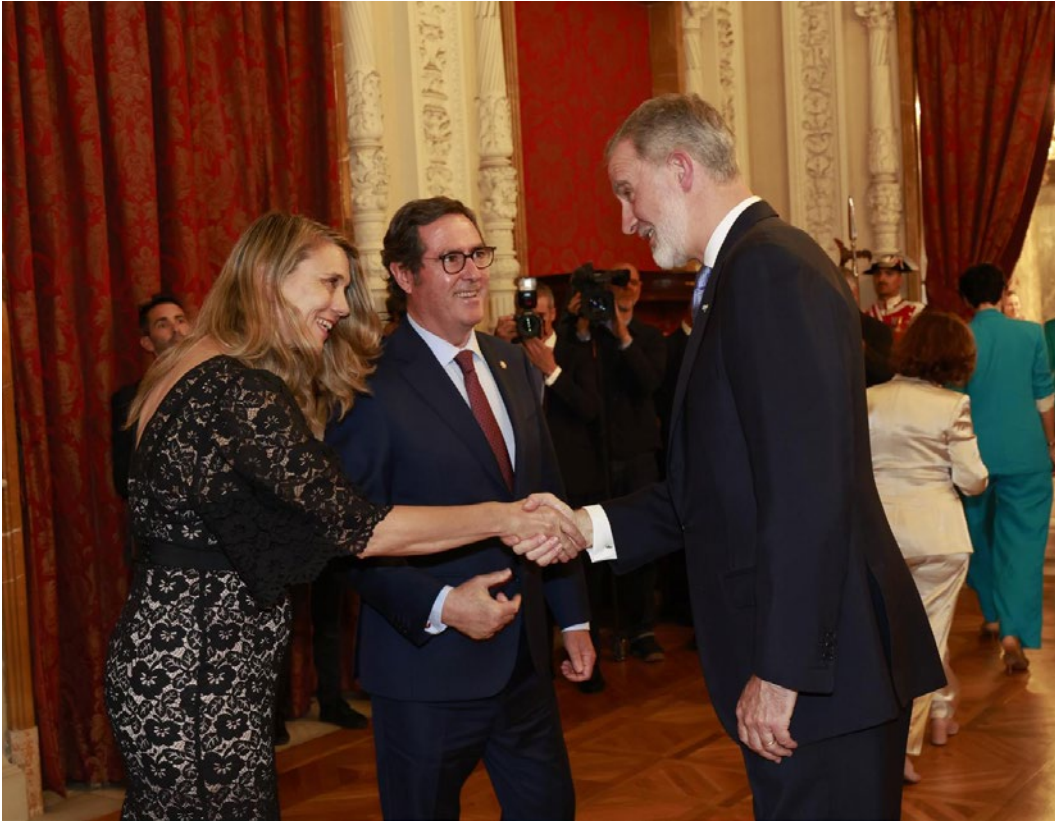
Acto de conmemoración del 40.º aniversario de la adhesión de España a la CEE.

La presidenta de CEPYME participó en el acto conmemorativo del 40.º aniversario de la adhesión de España a la entonces Comunidad Económica Europea (CEE). El acto se celebró en el mes de junio, en el Palacio Real, bajo la presidencia de SM el Rey Felipe VI.