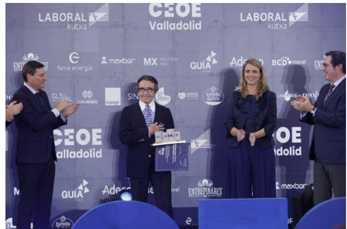
Un momento de la entrega de Premios de CEOE Valladolid.