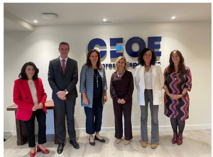
Representantes de los departamentos de Laboral de CEPYME y de CEOE con la directora de la OIT para Europa y Asia.

Por otro lado, en 2025 CEPYME participó en el Proyecto Europeo SMEs4SD, coordinado por la patronal de las pequeñas y medianas empresas europeas, SMEUnited, dirigido a impulsar la participación de las pymes en el diálogo social y en la elaboración de futuras iniciativas legislativas y no legislativas, fortaleciendo el papel de las pymes y garantizando que sus planteamientos se tengan en cuenta en el ámbito social y laboral y en el marco de la doble transición hacia una economía digital y climáticamente neutra.