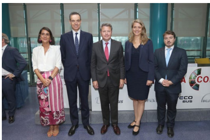
Asamblea General de Confebus.