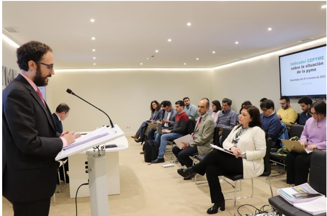
Presentación del Indicador CEPYME sobre la Situación de la Pyme.

vinculaciones entre la unidad de mercado, competencia y productividad, al igual que aspectos críticos tales como el papel de la inversión y las diferencias en la distribución de la productividad y la relación capital-trabajo por tamaño de empresa.