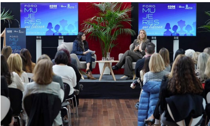
Foro Mujeres que lideran, protagonizado por la presidenta de CEPYME.