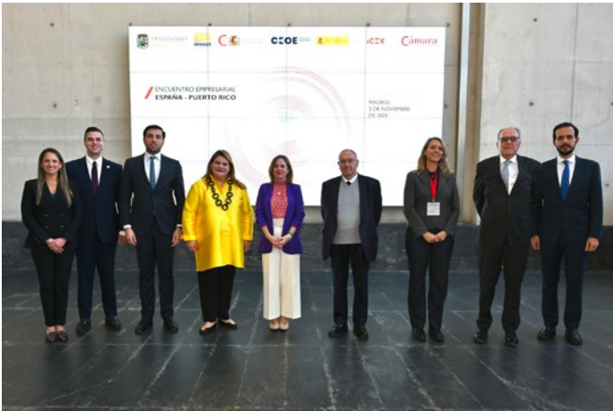
■ Encuentro Empresarial España Puerto Rico.

Puerto Rico, celebrado en noviembre; o la jornada sobre Mipymes España-México, que tuvo lugar en octubre.