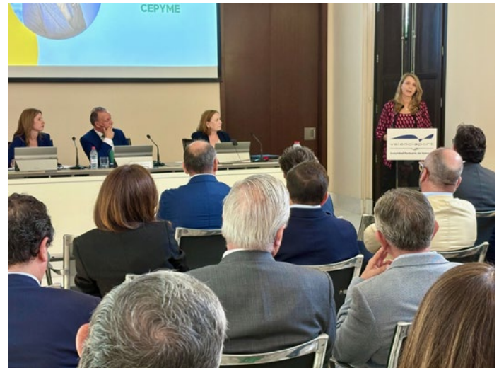
Reunión de la presidenta de CEPYME con el Comité Ejecutivo y la Junta Directiva de CEV, en Valencia.

Se mantuvieron encuentros de trabajo con representantes de los órganos de Gobierno de distintas organizaciones, de ámbito territorial y sectorial.