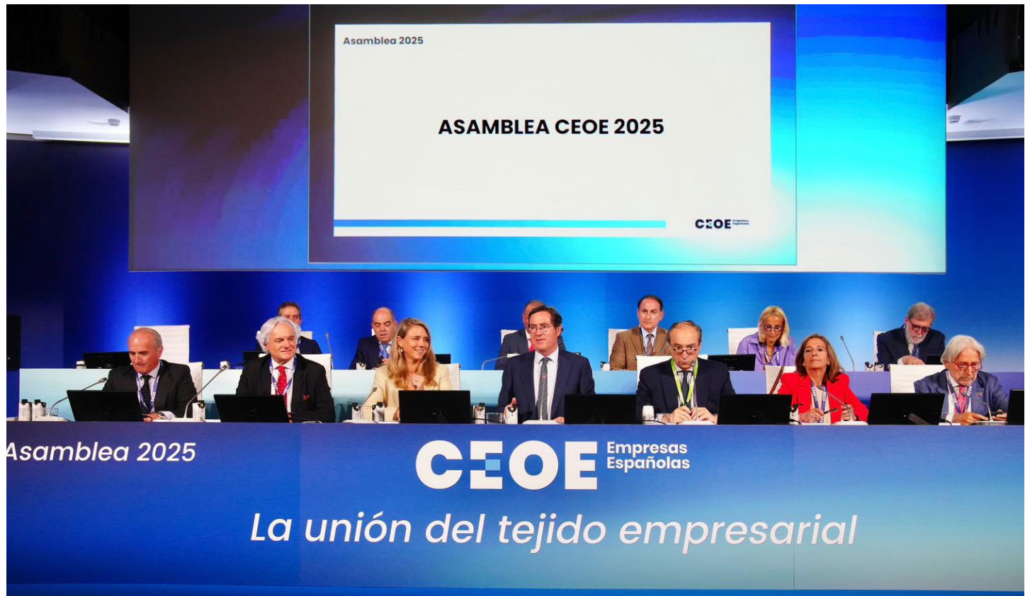
Un momento de la celebración de la Asamblea General de CEOE 2025.

Igualmente, los representantes de CEPYME participaron en la Asamblea General ordinaria de CEOE, celebrada el 16 de julio.