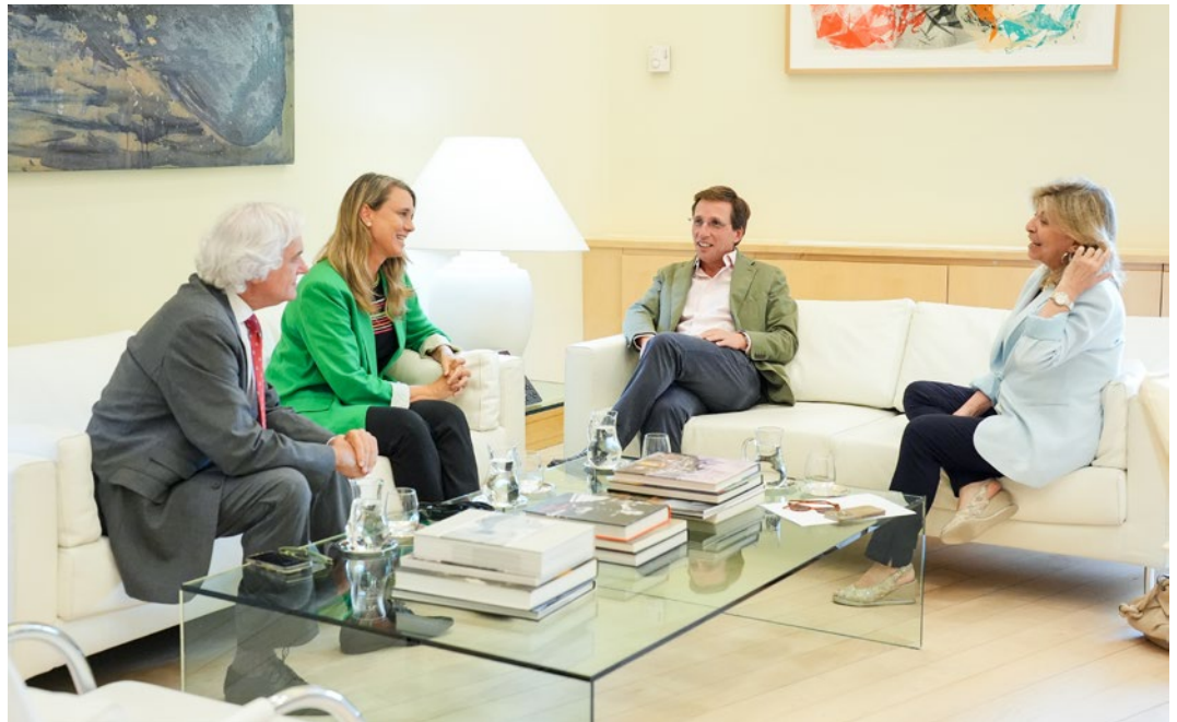
La presidenta de CEPYME, con el presidente de CEIM y el alcalde de Madrid.