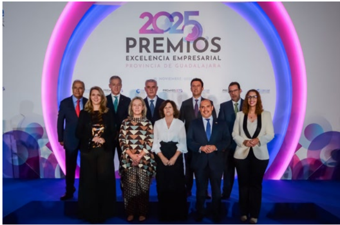
Foto de familia de los Premios de CEOE CEPYME Guadalajara.