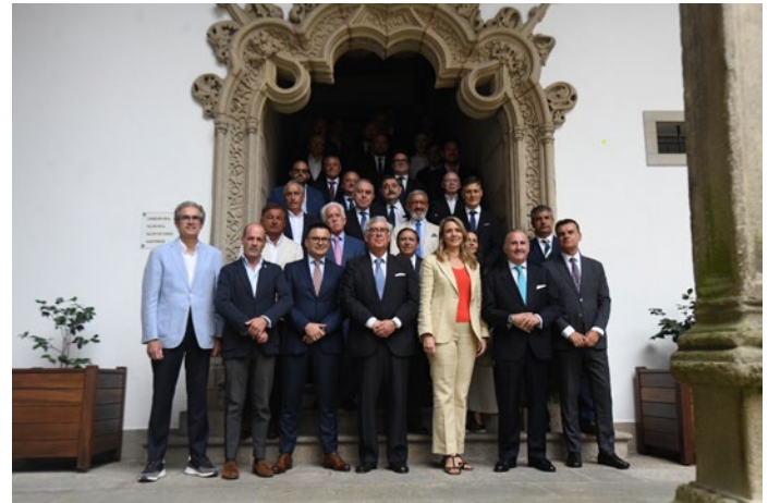
■ Encuentro empresarial de la CEG.