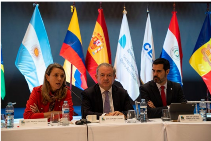
■ XVI Encuentro Empresarial Iberoamericano.

Asimismo, la presidenta de CEPYME tuvo una participación destacada en el XVI Encuentro Empresarial Iberoamericano, que con se celebró en Tenerife, en noviembre y en el Foro Ibero Africano, que coincidió en fecha y lugar con el primero.