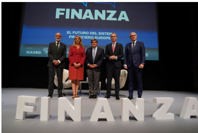
La presidenta de CEPYME intervino en el Foro Finanza, celebrado en Pamplona (Navarra).