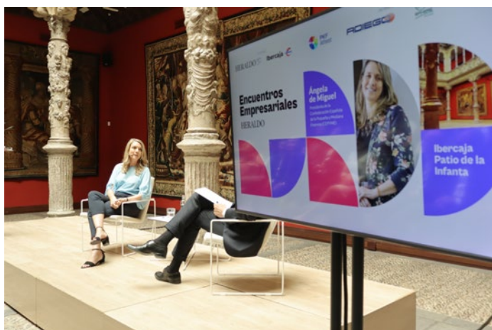
Encuentro informativo de El Heraldo de Aragón.

Durante 2025 se difundieron más de un centenar de notas de prensa y comunicados sobre la situación de las empresas, la incidencia del incremento de costes y de las nuevas medidas en el ámbito laboral y la necesidad de medidas de apoyo para las empresas.