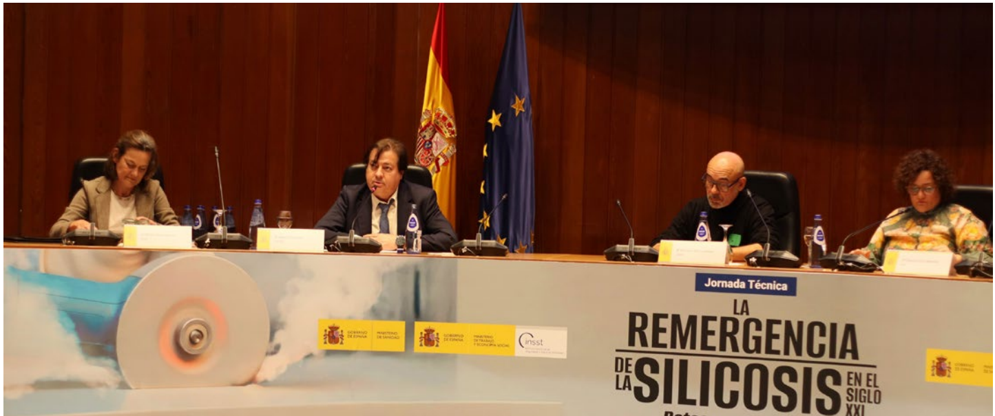
Jornada de prevención de riesgos sobre la silicosis.

En el marco de la prevención de riesgos laborales, destaca la colaboración con el Instituto Nacional de Salud y Seguridad en el Trabajo (INSST) y la participación de CEPYME en la Comisión Permanente y el Pleno de la Comisión Nacional de Seguridad y Salud en el Trabajo, así como en sus grupos de trabajo: de Trastornos Musculoesqueléticos; de Riesgos Psicosociales; para la Transición Digital, Ecológica y Demográfica; de Valores Límite; de Amianto; de Sílice Cristalina Respirable; de Notificación y Registro de Accidentes de Trabajo y de Seguridad Vial Laboral, así como en el Comité de Enlace – Punto Focal Agencia Europea.