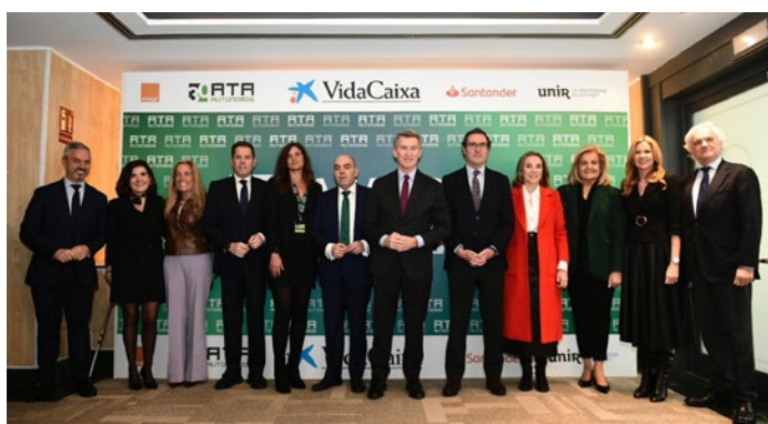
Asamblea general electoral de ATA.