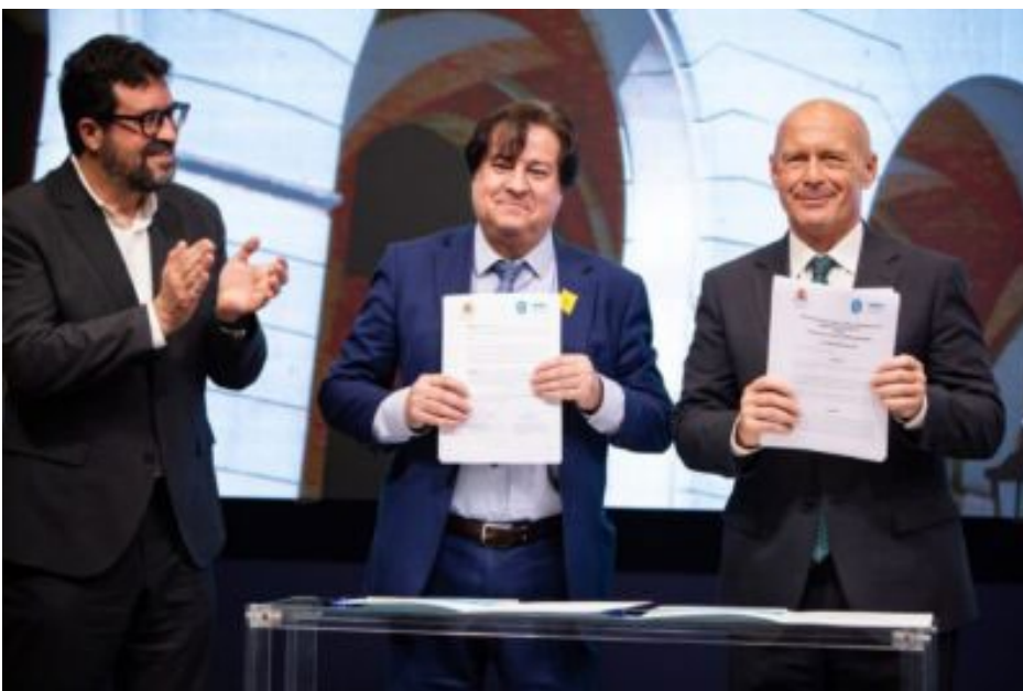
Protocolo de Actuación y Puesta en Marcha de la Mediación Intrajudicial entre la Sala de lo Social de la Audiencia Nacional y la Fundación SIMA-FSP.

Por último, cabe reseñar la participación en diferentes jornadas y encuentros, organizadas por instituciones nacionales e internacionales o por medios de comunicación.