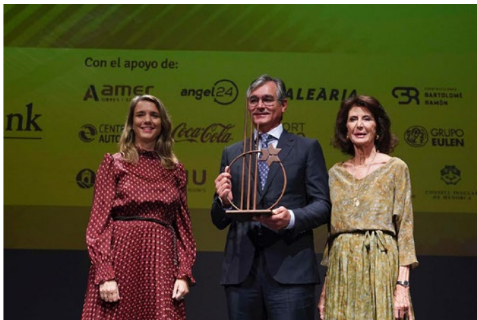
Un momento de la entrega de premios de la Gala CAEB.