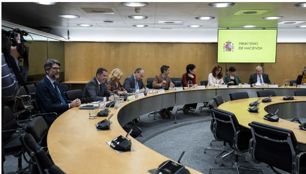
Reunión de seguimiento del Plan de Recuperación, Transformación y Resiliencia.

CEPYME participó en los encuentros periódicos celebrados en el marco del Plan de Recuperación, Transformación y Resiliencia, presididos por el ministro de Economía, Comercio y Empresa, Carlos Cuerpo. En estas reuniones, la Confederación trasladó las principales necesidades de las pymes y reclamó una reducción de las trabas administrativas para facilitar el acceso a los fondos europeos y mejorar el marco de actividad de las empresas.