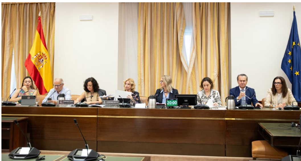
Reunión de la Comisión Permanente de Seguimiento del Pacto de Toledo.

Las dificultades para la tramitación de proyectos normativos en el Parlamento, con una elevada incertidumbre respecto al traslado a la normativa de los posibles acuerdos, han llevado al Ministerio de Trabajo y Economía Social a abordar algunas regulaciones a través de desarrollos reglamentarios, con el peligro de vulneración del principio de legalidad y de jerarquía normativa.