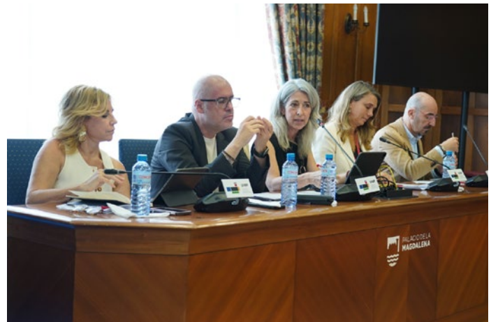
Mesa de Interlocutores sociales, en una jornada sobre el Pacto de Toledo.

En la práctica, los resultados de este intenso diálogo social no fructificaron, en buena medida por la falta de voluntad por parte del Ejecutivo para escuchar y atender las propuestas empresariales, interfiriendo en materias propias de la negociación colectiva, lo que en ocasiones desembocó en la firma de acuerdos entre el Gobierno y las organizaciones sindicales.