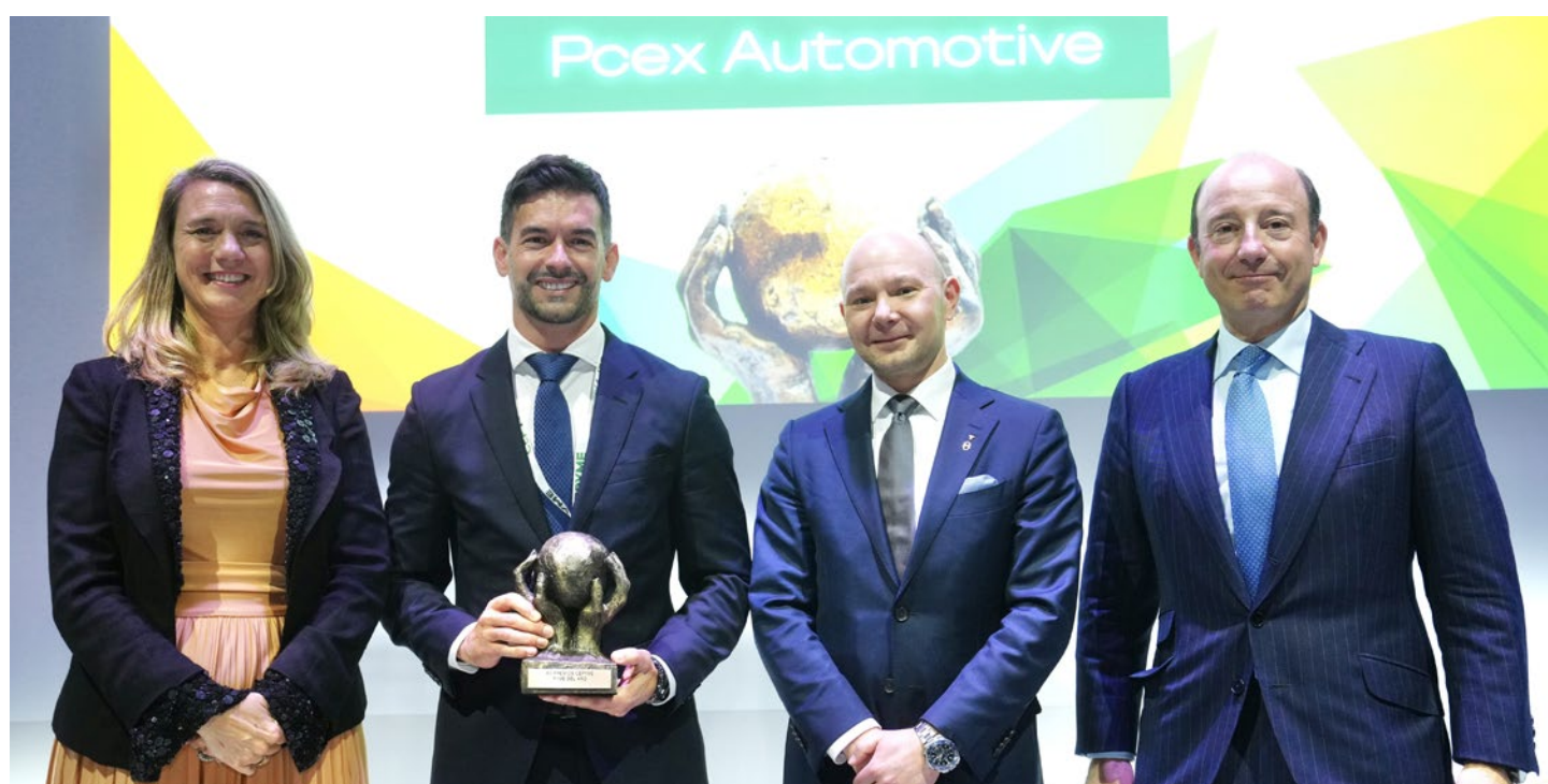
Entrega del Premio CEPYME Pyme del Año 2025.