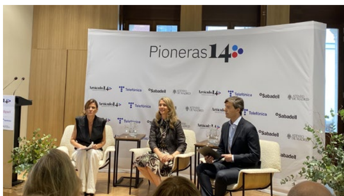
Encuentro Pioneras, de Artículo 14.

La presidenta de CEPYME participó también en diversos encuentros informativos, como el Encuentro Pioneras, organizado por Artículo 14, en mayo; el Encuentro Empresarial organizado por Heraldo de Aragón, en junio o la reunión con los integrantes del Foro Arekuna, en septiembre.