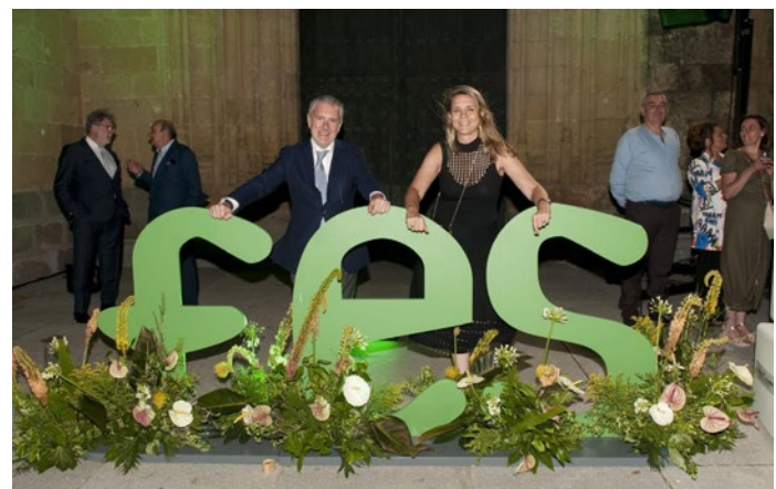
Los presidentes de FES y de CEPYME, en el acto de la entrega de Premios Empresariales de Segovia.