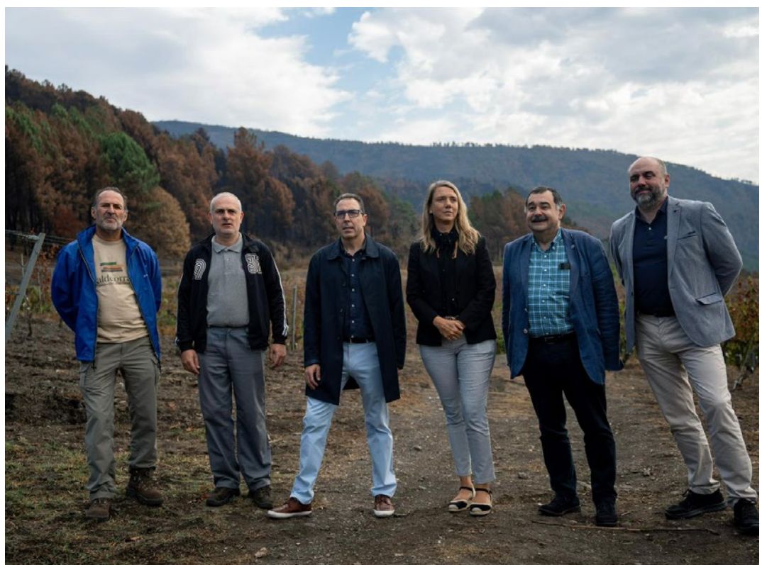
La presidenta de CEPYME, acompañada del entonces presidente de la Confederación de Empresarios de Orense, visitó la comarca de Valdeorras.

En esta misma línea, la presidenta de CEPYME asistió al acto institucional y funeral de Estado que se celebró en Valencia con motivo del primer aniversario de la Dana que asoló varias localidades valencianas en octubre de 2024.