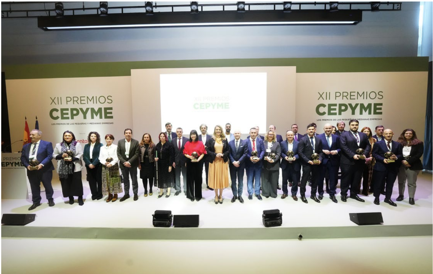
■ Foto de familia de los premiados y patrocinadores de los XII Premios CEPYME.