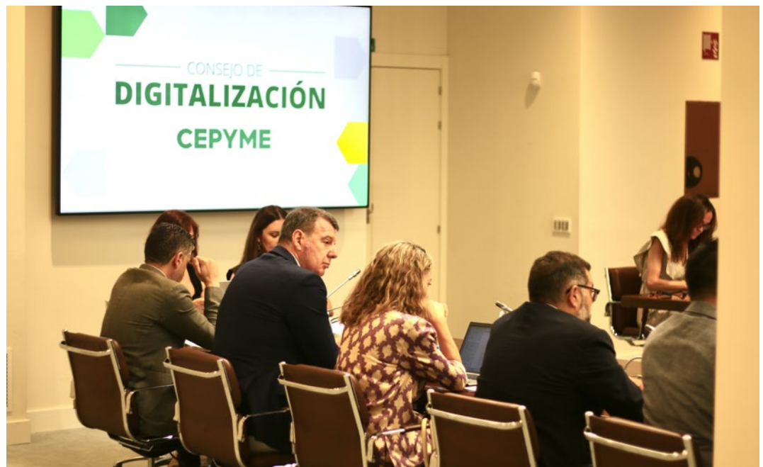
Reunión de trabajo del Consejo de Digitalización de CEPYME.

Desde la perspectiva de la productividad, CEPYME ha tenido un papel activo en el Consejo de la Productividad de España, foro en el que cuenta con voz, pero no con voto, y cuyos trabajos a lo largo de 2025 se han plasmado en un primer informe a principios de 2026. Dicho informe, entre otras cuestiones, abordó la relevancia de las