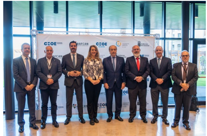
■ Foro Ibero Africano.