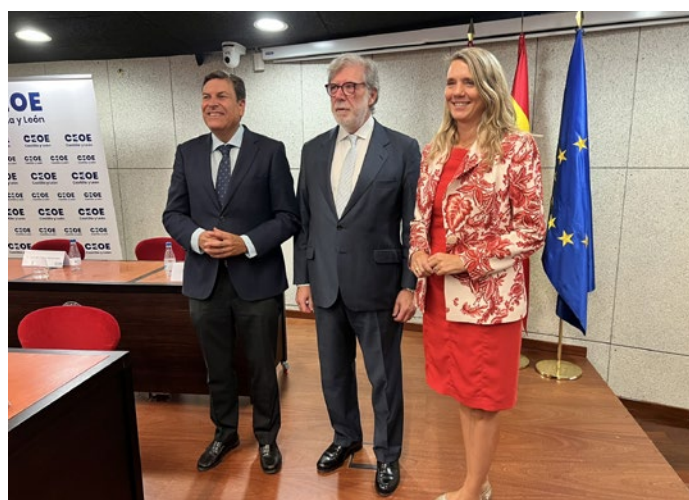
Asamblea General electoral de CEOE Castilla y León.