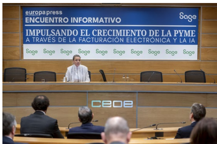
Intervención en el encuentro informativo organizado por Europa Press y Sage.